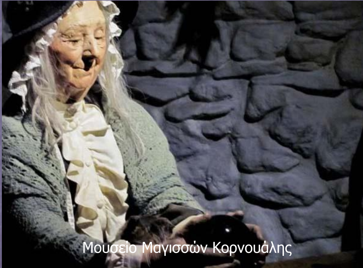
Μουσείο Μαγισσών Κορνουάλης