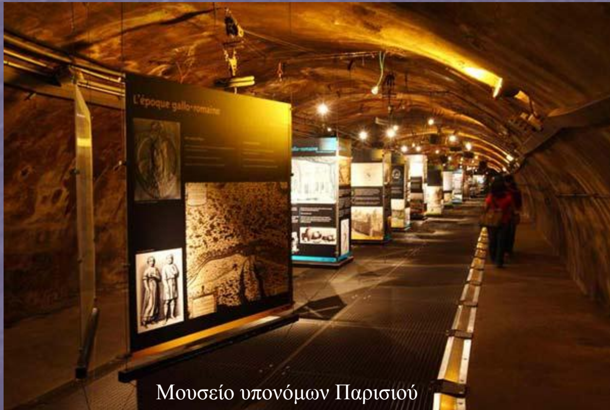
Μουσείο υπονόμων Παρισιού