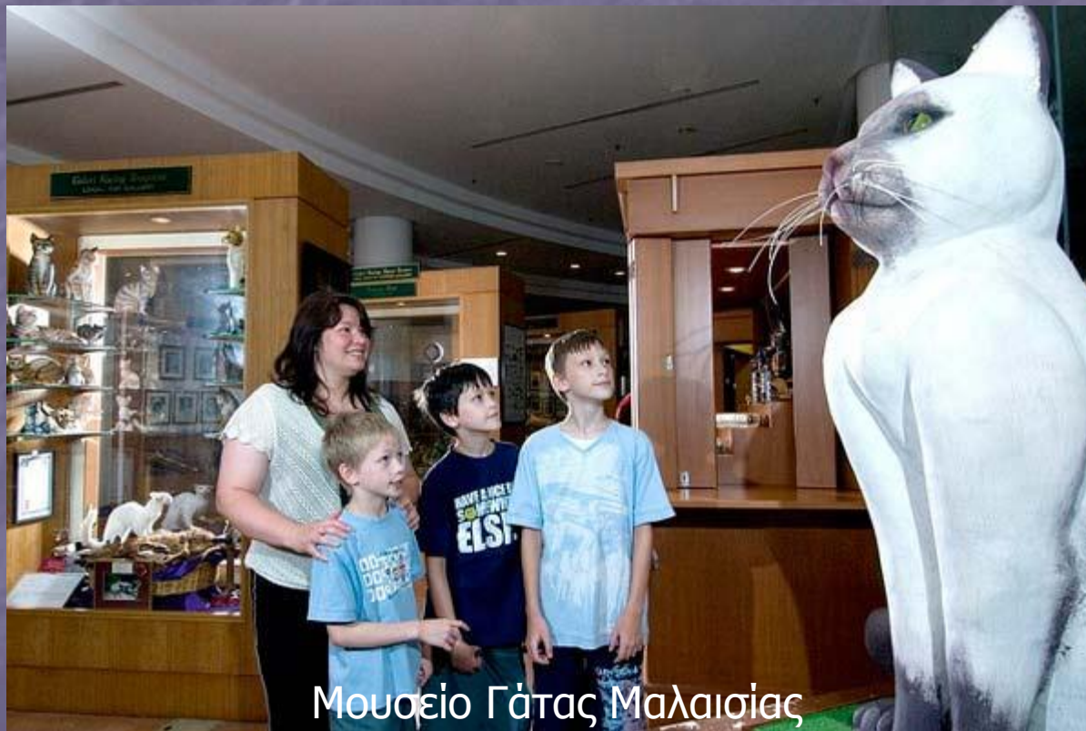
Μουσείο Γάτας Μαλαισίας