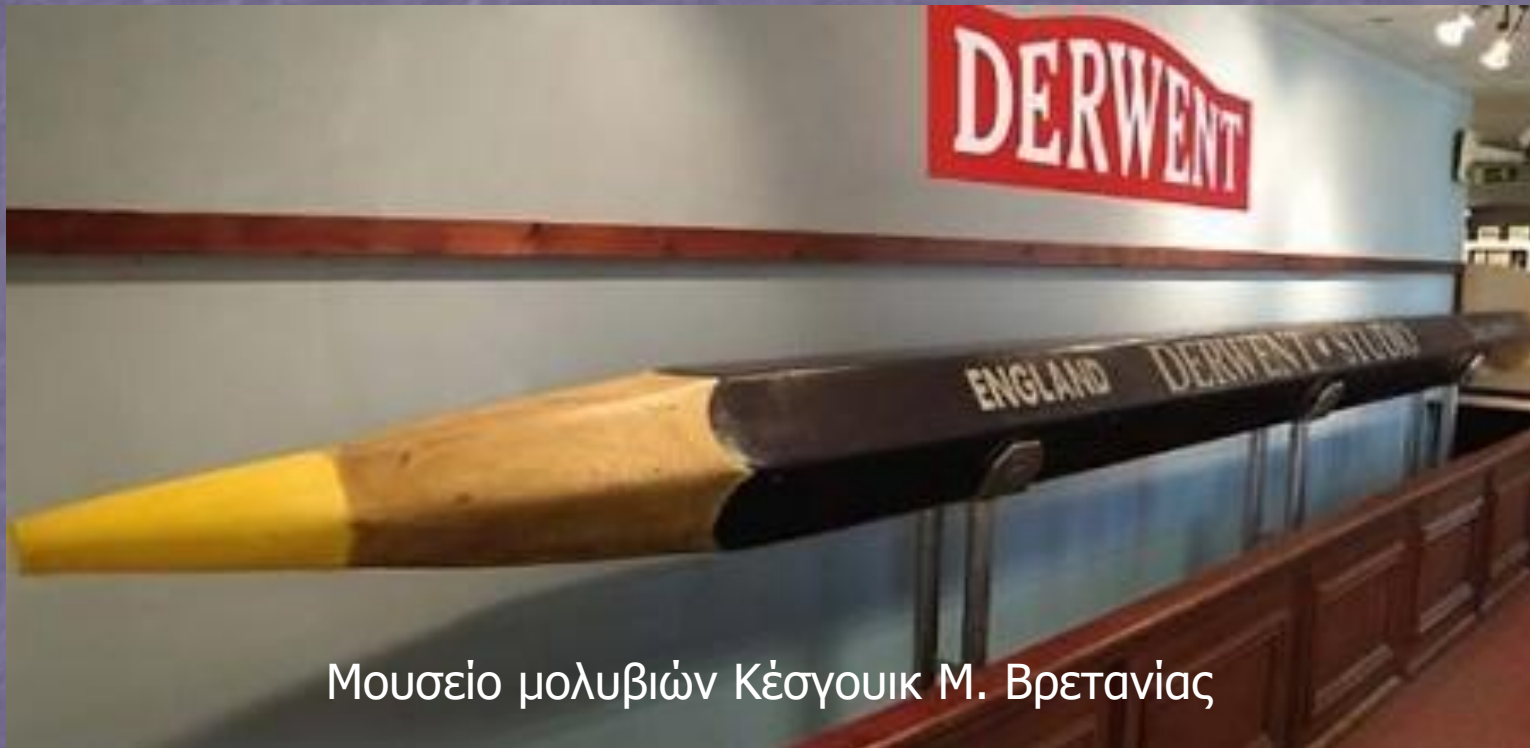
Μουσείο μολυβιών Κέσγουικ Μ. Βρετανίας